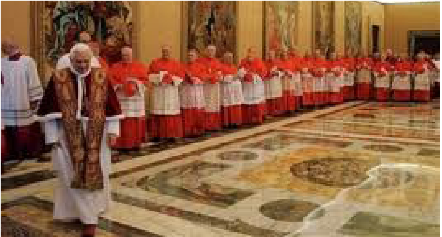
Cardinals following the Pope to attend the Consistory